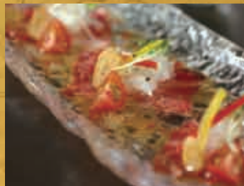
鳥取和牛のカルパッチョ 680円