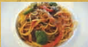
鳥取野菜と 鳥取和牛スネ煮込み ソースの Pasta 1,000円