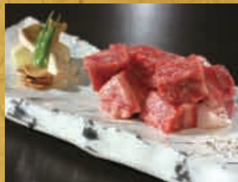
鳥取和牛のサイコロステーキ 1,800円