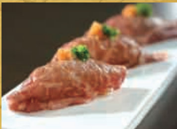
鳥取和牛の炙り寿司 840円